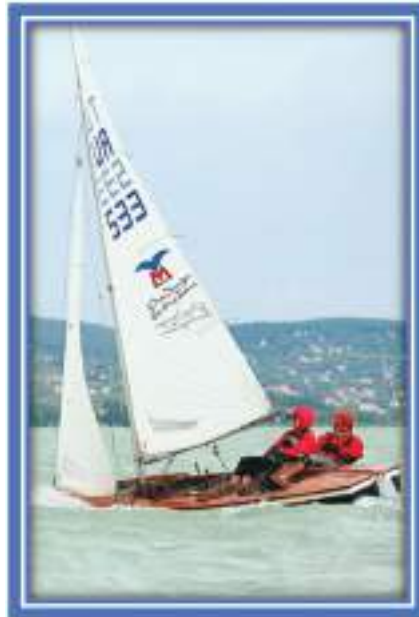
PİRAT SINIFI TEKNE

Bu arada aklıma geldi. Okulda 5,20 metre Pirat sınıf yelkenli teknesi vardı. 1968 yılında onu 3 arkadaş yapmıştık. FENERBAHÇE Yelken kulübünden iki hoca gelip bize ders vermiş ve ehliyet vermişti.