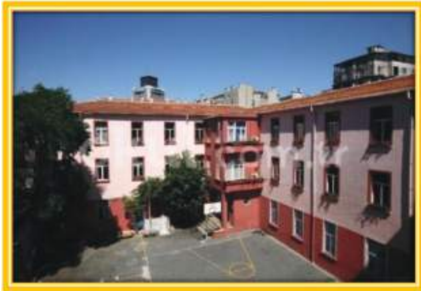
BEYOĞLU ATATÜRK FEN LİSESİ

Ben, Türkiye'nin ilk Fen Lisesi olan Beyoğlu Atatürk Fen Lisesi'nin ilk mezunlarından biriyim.