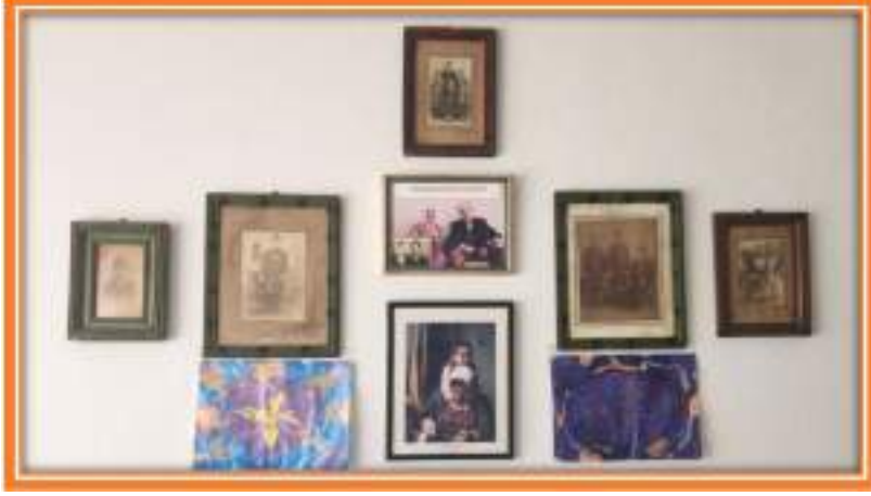
EVİNİN DUVARINDAKİ AİLE RESİMLERİ

Erzincan'ın Kemaliye (Eğir) ilçesinin Enciti Köyü'nde doğdum. 4 yaşında İstanbul'da çalışan babamın yanına geldim. Daha sonra köye dönüp 5 sınıfın tek derslikte okuduğu okulda 3. sınıfa kadar okudum. Sonra İstanbul'a temelli olarak döndüm. İstanbul'a bu evimizin olduğu yere geldik. Geldiğimizden beri buradayız. Bu apartman bizim aile apartmanımız. Babam sanatkârdı. İnşaat, marangoz ve demir işlerinden anlardı.