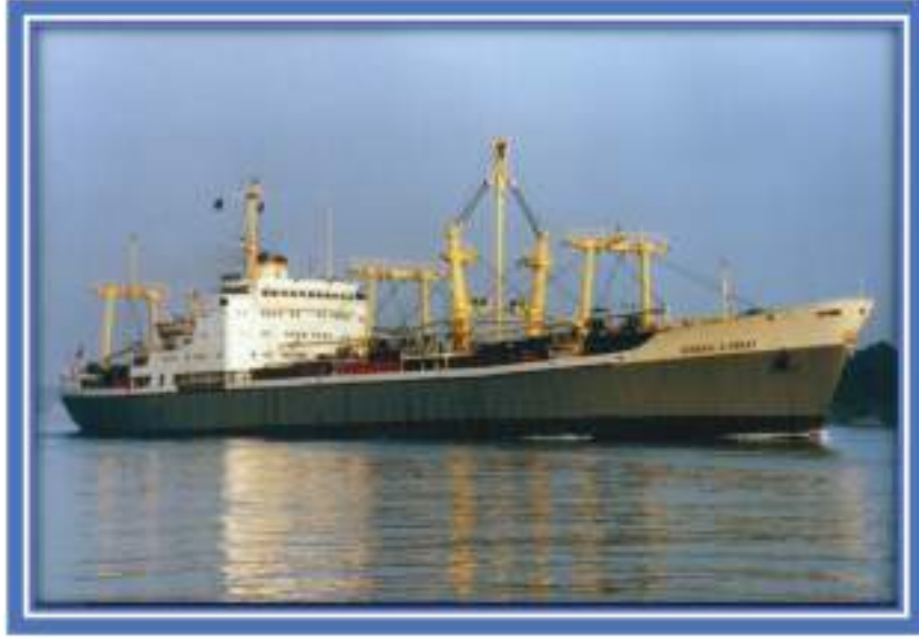
GENERAL KAZIM ORBAY

Bu gemide çok problemler yaşadım. Amerika'ya gittik, dolaştık Akdeniz'e döndük, Suriye'nin Lattakia Limanı'na geldik. Suriye İsrail Savaşı patlak verdi. Muharrem ayı. 1974 yılı. Ben böyle hainlik görmedim. Bizi önce demire aldılar, etrafımızı mayınlarla çevirdiler. Kımıldayamıyoruz. İsrail Limanı bombalayacaksa önce bizi batırması gerekiyor. İsraililer, sivil gemileri vurmamak için liman etrafında dört dönüyorlar. 4 metre önümüze uçak düştü, füzeler üstümüzden vızır vızır geçiyor. Ciddi harp yaşıyoruz. Allah'tan yolculardan birisinin Ankara'dan bir tanıdığı varmış kadıncağız sayesinde Şam' a ve limana baskı yaptılar, biz limandan çıktık. Biz orada iken, Doğu Alman Gemisi'nin bacasından içeri sam füzesi girdi, başka bir geminin makinesinden içeri girdi. Bir Japon geminin ambarından içeri girdi. Adamlar hemen müdahale ettiler sabaha kadar yüzdürmeye çalıştılar ama gemi öğleden sonra battı. Tek kurtulan biz olduk.